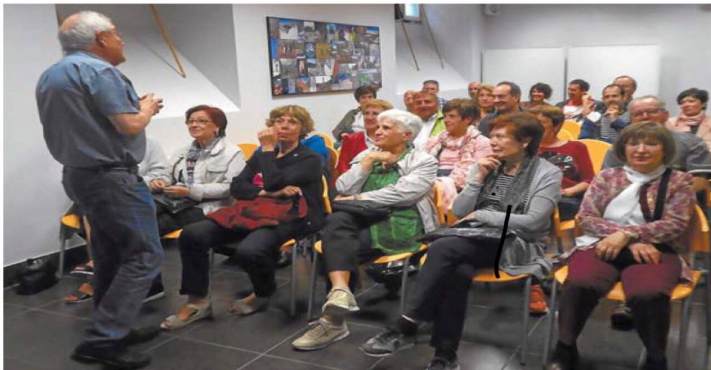
Participantes. Colofón final al curso con la proyección de la película 'Demain', de temática medioambiental.