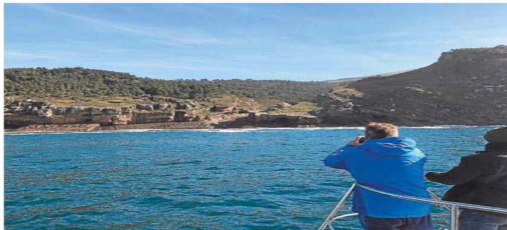
Travesía por los acantilados de Jaizkibel y Ulia en catamarán, una visita realizada en una edición anterior.

La energía será el tema de debate en la sesión del 28 de noviembre. Investigadores del proyecto Trade-